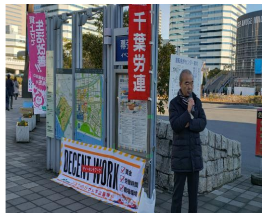
J R 海浜幕張駅で大企業宣伝で格差解消を訴える

通常国会で野党は、「桜を見る会」問題、カジノ汚職、中東問題の 3 本柱を追及するとのことですから大いに頑張ってもらい、私たちも世論と運動を広げましょう。そして、野党連合政権の実現のために、この間の共闘の広がりには確信を持ち、統一戦線の一翼を担う立場で奮闘したいと思います。