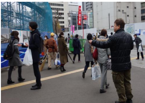
JR千葉駅の駅頭で労働者に向けて新春宣伝

1月7日、JR千葉駅・旧クリスタルドーム前で新春宣伝をおこない、自治労連や千葉労連ユニオンなどから11人が参加しました。