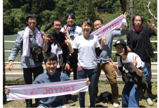
前回の JOYNET のひとこま